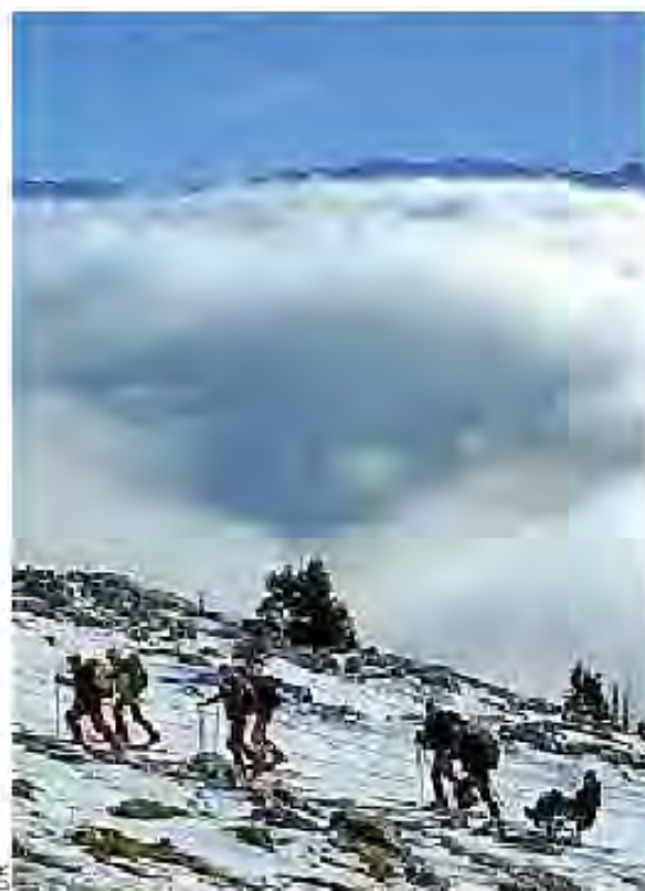
Une sortie avec des amis en janvier.